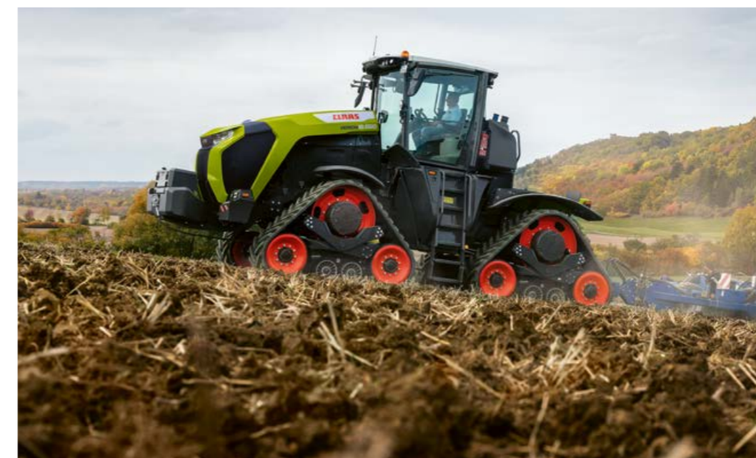
◀ Affjedringskonceptet – lige fra bælteundervognen med dæmpningsegenskaber over 4-punkt-kabineaffjedringen til det affjedrede premiumsæde – sørger for en særligt stor kørekomfort i XERION.