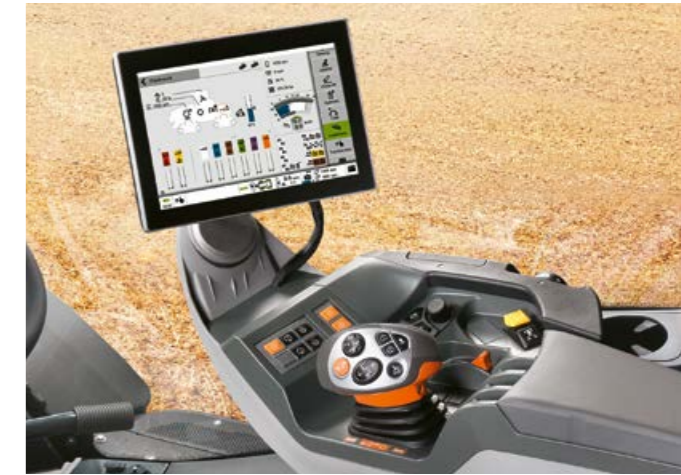
▲ Let betjening. Intuitiv maskinindstilling og den bedste betjeningskomfort med CEBIS høstinformationssystemet og CMOTION multifunktionshåndtaget.

High-end-lygtepakker med op til 22 arbejdslygter bader omgivelserne omkring maskinen i lys så kraftigt som dagslys, så du altid har det bedste udsyn til redskaberne og marken.