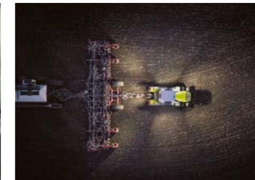
◀ High-end-lygtepakken med op til 22 LED-lygter lyser omgivelserne op i en 360°-radius med 53.400 lm. Alle lygter kan indstilles efter arbejdet.